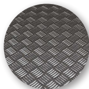
Piano in alluminio mandorlato antiscivolo