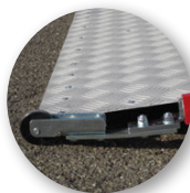
Ruota per apertura facilitata