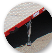
Piedini autoposizionanti regolabili