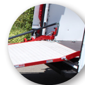
Bandella mobile che raccorda al piano